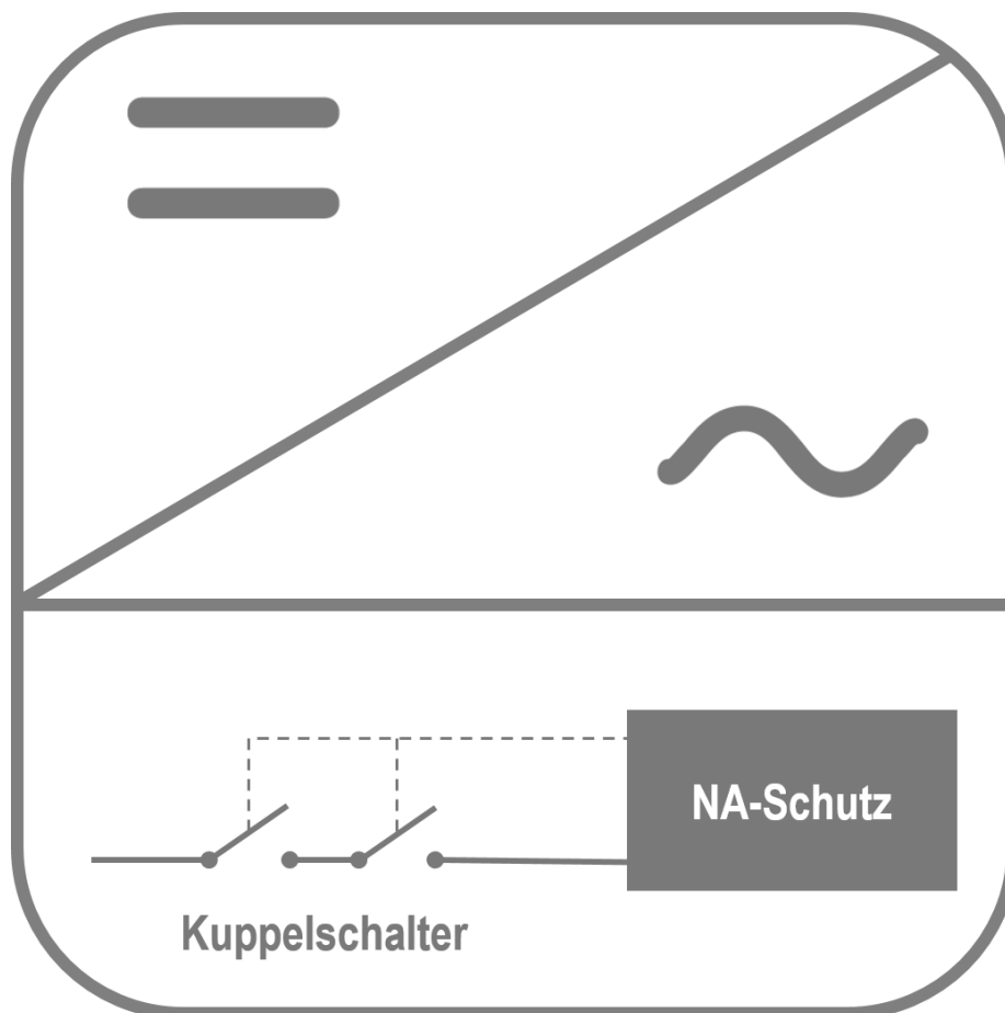
Abbildung 1: Wechselrichterintegrierter NA-Schutz bei Anlagen bis 30 kVA

Grundsätzlich hat jeder Wechselrichter einen Netz- und Anlagenschutz integriert. Der interne NA-Schutz misst die Netzspannung und die Netzfrequenz und schaltet die PV Anlage über die integrierten Kuppelschalter ab, sobald die Abschaltbedingungen erfüllt sind. Der Netz- und Anlagenschutz sowie der redundant ausgeführte Kuppelschalter befinden sich beide im Wechselrichter. Bei PV-Anlagen mit einer Leistung bis zu 30 kVA ist dieser NA-Schutz, welcher im Wechselrichter verbaut ist, ausreichend. Es wird also kein externer NA-Schutz benötigt.